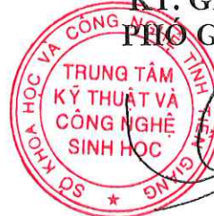
Võ Trung Hiếu