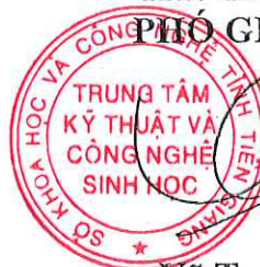
Võ Trung Hiếu